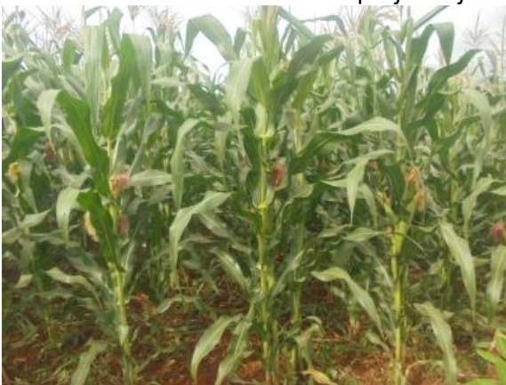
Hier zitten grote kolven aan. Ziet er goed uit.