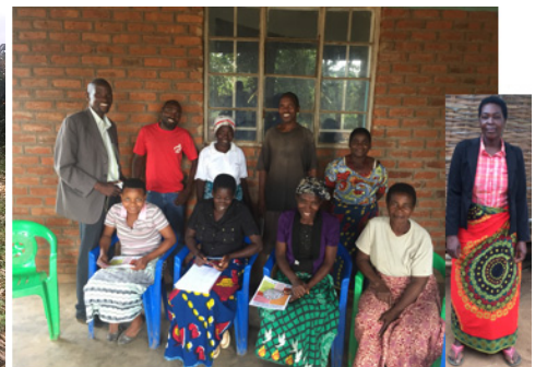
Het Expert Team