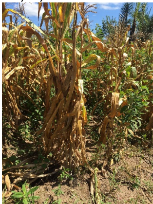
De maïs in al zijn weelde

Elke deelnemer staat nog een halve zak maïs af voor de nursery scholen in de gemeenschap zodat daar maïsplantjes van gemaakt kan worden om uit te delen aan de kinderen. Het aantal schoolgaande kinderen zal hierdoor hopelijk ook weer toenemen. Dit project wordt nog verder uitgebreid met meer deelnemers, waarvoor een Expert Team is samengesteld. Zij gaan op cursus om compost te leren maken, zodat ze niet meer zoveel geld kwijt zijn aan kunstmest.