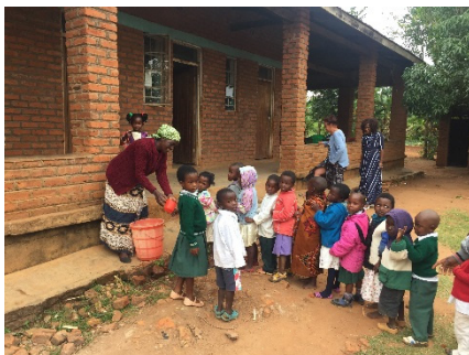
Kindjes in de rij om hun handen te wassen