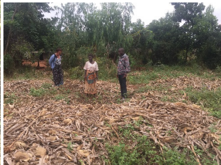
Het land als er is geoogst