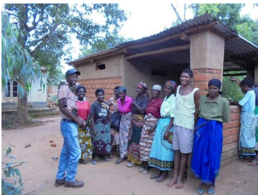
De Disabled Group bij hun geiten