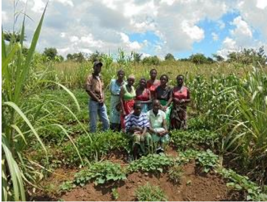
Tuin van de Support Group met sweet potatoes and maize.